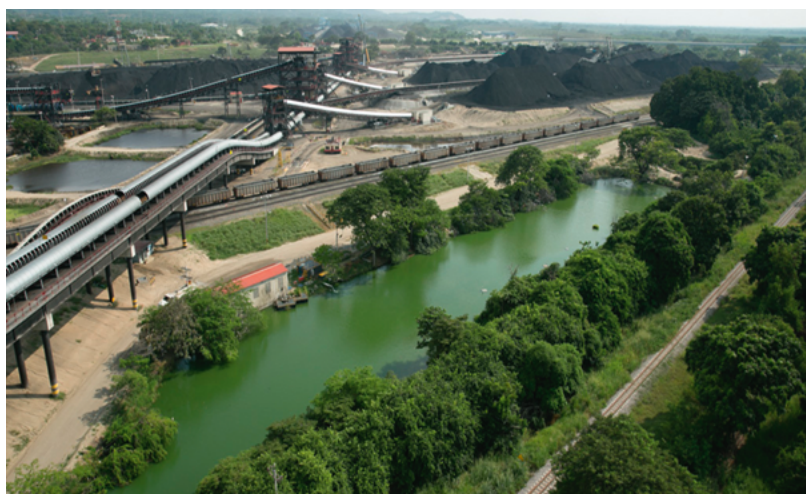
↑ Panorámica de Puerto Drummond.