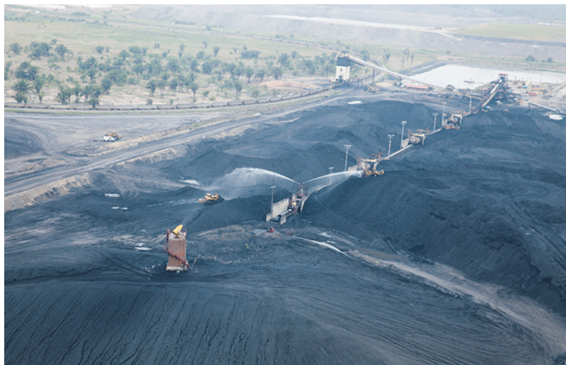
↑ Cañones de agua para reducir el material particulado en mina.