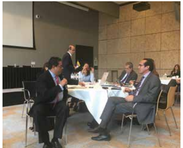
En las reuniones se compartieron las buenas prácticas que Drummond lleva a cabo en toda Colombia.