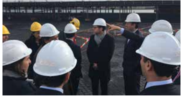
Momentos de la visita con diversos actores del sector minero en Europa.