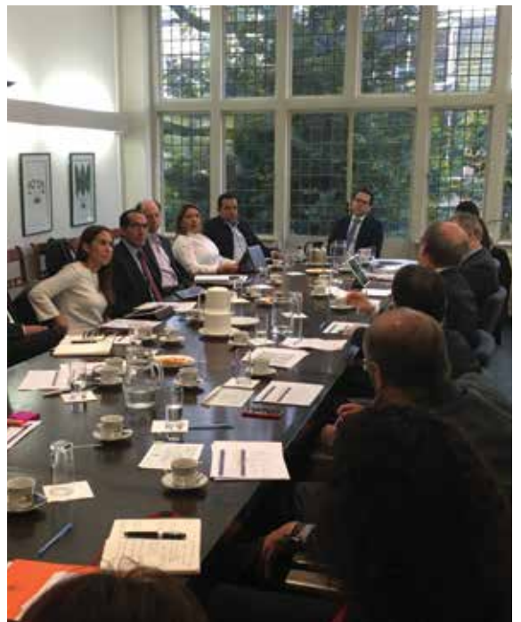
Reunión en la embajada de Colombia en Países Bajos.